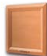
CI CILIEGIO NEBBIOLO