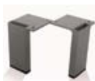
Filo h 10 mm.