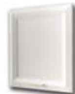
BF FRASSINATO BIANCO