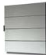
STOPSOL INCISO (solo per ante scorrevoli)