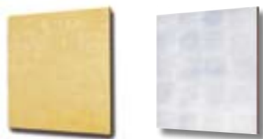
OR FOGLIA ORO