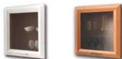
BF FRASSINATO BIANCO CON VETRO TRASPARENTE