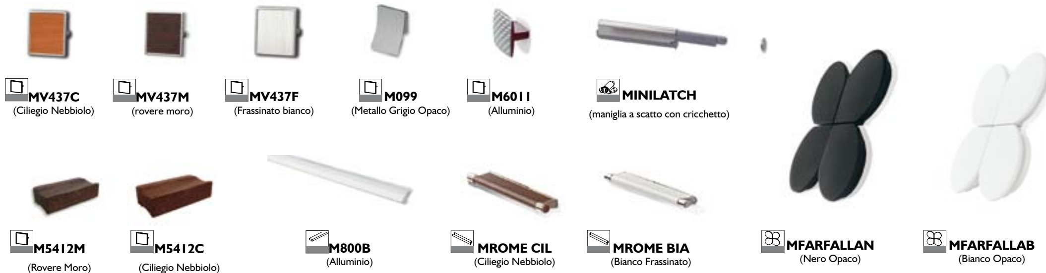
MV437C (Ciliegio Nebbiolo)